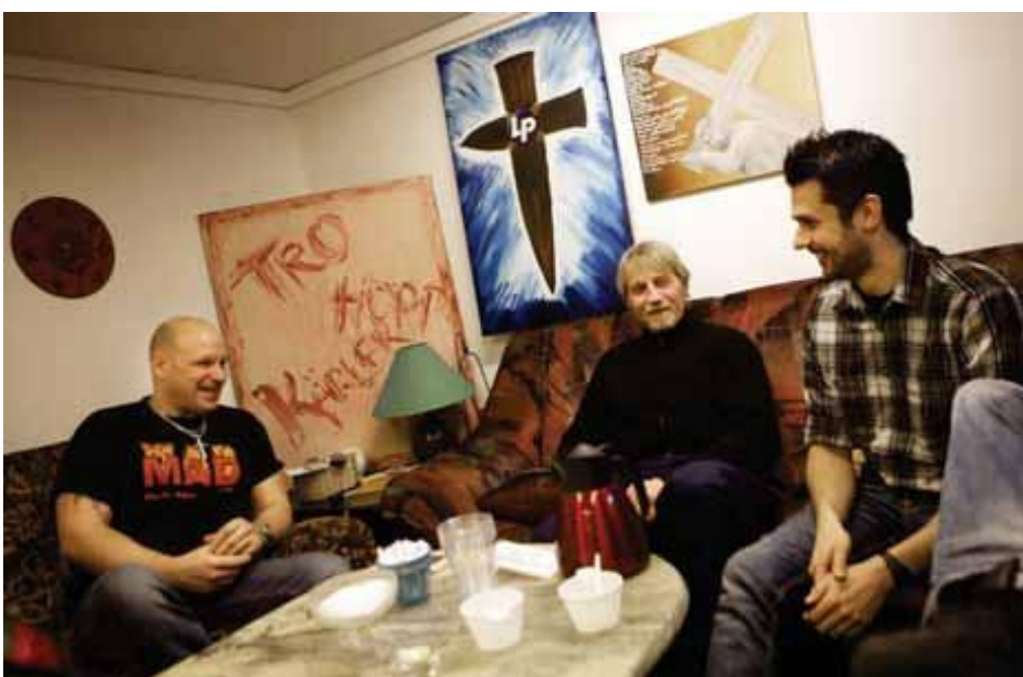
DRAR I GÅNG LP-VERKSAMHET