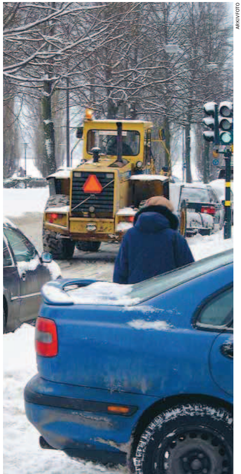
VITT ELLER GRÅTT. Mycket snö eller ingen snö har ingen betydelse för stadens finanser.